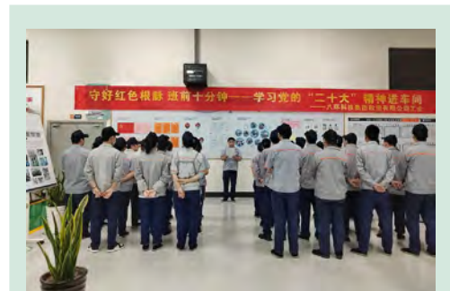
二十大精神进车间