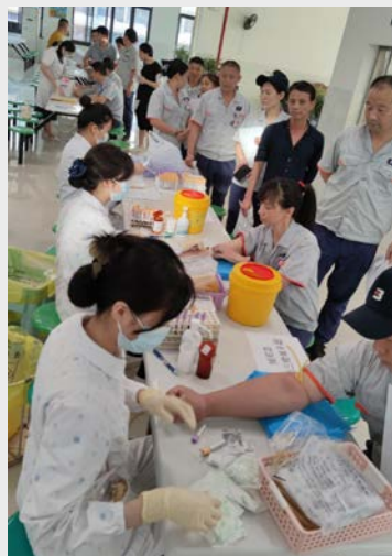
9月22日,公司安排医疗机构上门开展员工年度体检,为一线员工提供便利。(林江)