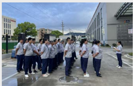
9月初,通用车间组织全体员工在车间现场进行了第23次“质量月”活动动员大会。