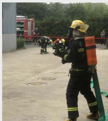
9月27日,在长兴县消防中队的指导下,八环(长兴)公司组织安全员进行了一次危化品演练。(张朝晖)