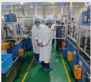
9月28日~29日,岱高公司一行2人对八环(长兴)公司生产线进行现场审核指导。(张影影)