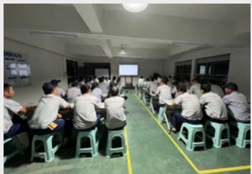
9月30日,通用车间组织全体成员进行了企业文化核心价值观的培训,并要求骨干对照标准开展自评学习,及时发现自己的不足之处。(杨玉珍)