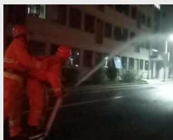
9月15日夜,公司微型消防站工作人员组织开展了出水实操演练,提高业务水平。(叶连友)