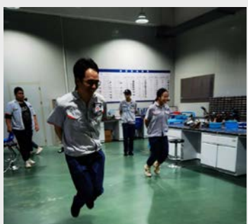
中秋节前夕,质量部外协检验班组组织开展了“嫦娥奔月”等班组活动,提高团队协作能力及按标准作业的意识。(余成瑛)