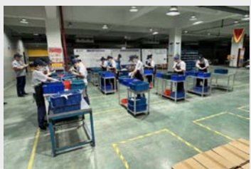
9月,质量月活动期间,通用车间对包装组外观人员进行了不良品混入的验证竞赛,提升外观人员技能水平。(胡娇英)