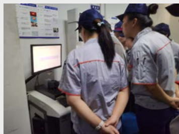
9月17日,为统一某产品硬车倒角的检测方法,质量部毛工对外协和成品检验班组进行了专项培训。(余成瑛)