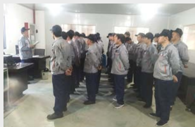
3月21日,基础车间邀请工程技术人员进行了特种产品理论与实操知识的培训。(廖小华)