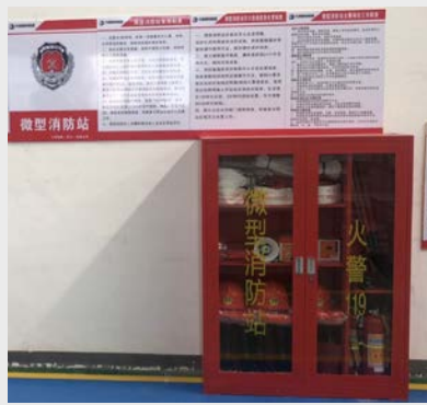
3月26日,长兴公司对微型消防站进行了进一步完善,明确了站长、值班员、消防员及其职责,为安全生产提供了有力保障。(张朝晖)