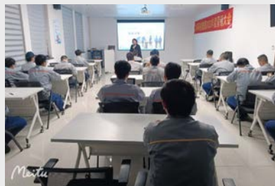
3月17日,公司外聘讲师对集团研发、工程技术、质量等相关人员进行了职称评审培训。(谢小敏)