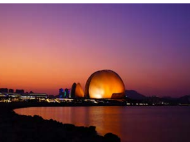
海上歌剧院