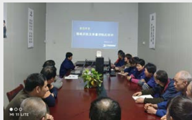
3月11日,新昌环富公司对全体员工进行了质量控制点和图纸识别的培训。(冯幸国)