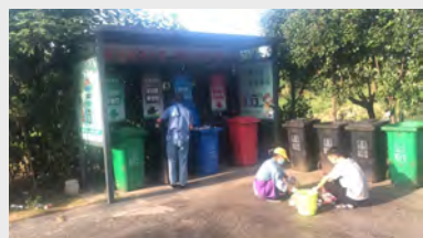
为积极响应政府号召,8月份开始,八环(长兴)公司对厂区垃圾进行分类投放,并制定了垃圾分类的相关制度,让厂区环境更加美好。(张朝晖)