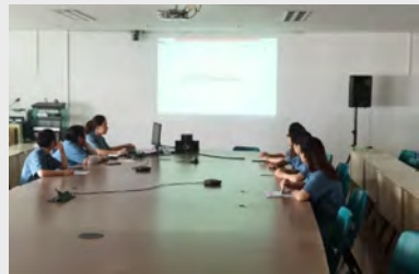
8月27日,质量部组织外协检验员进行了《轴承套圈车件质量验收标准》培训。(余成瑞)