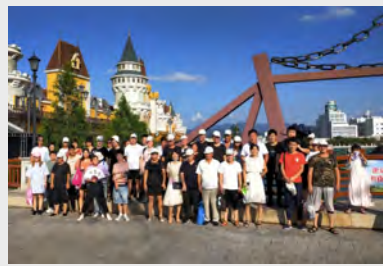
8月2日,制造一车间组织工会会员赴丽水冒险岛水世界一日游。(张锁权)