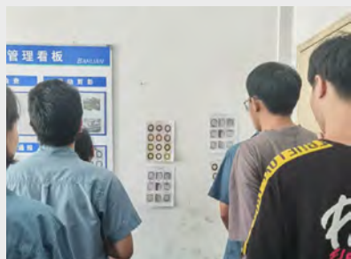
7月29日,质量部外协检验班组进行了“外观不合格项对号入座贴贴”活动,让检验员既掌握了不合格检验项,又提高了班组成员间的配合默契度。(余成瑞)