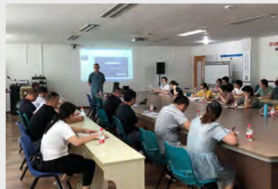
7月18日,质量部组织供应商参加《关于供应商失效评价8D报告培训》,提升供应商对质量问题的分析和解决能力。(杨信微)