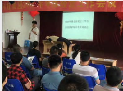
7月26日,路北街道红十字会联合行政人事部对公司员工进行了急救知识的普及培训。(王英)