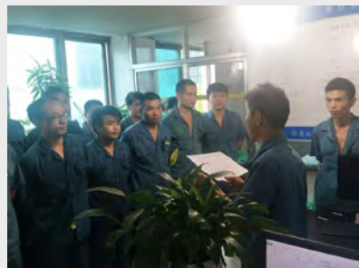
7月,制造四车间磨加工班组针对各工序常见质量问题进行了全员培训。(廖小华)