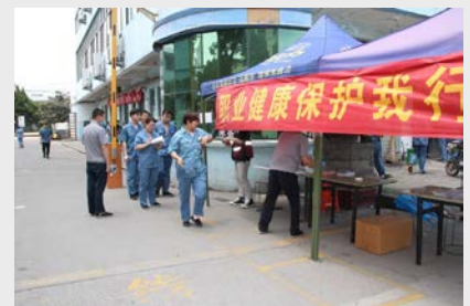
5月19日,路桥区疾控中心来八环公司开展“职业健康保护我”健康科普行动。(王振)